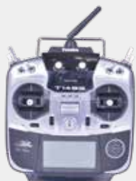
送信機 (双葉製 T145G)