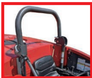
防護フレーム折畳み時

防護フレームは、転倒時にスプレーヤと地面の間に空間をつくることで、オペレータを保護します。 防護フレームは、散布時に枝や果実などの障害になる場合を除き、常に立てて正しくシートベルトを着用した 状態でご使用ください。防護フレーム 3点セットは防護フレーム、シートベルト、ヘルメットのセットです。