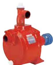
販売価格 MLP383-1 ¥73,700 (税込 10%)