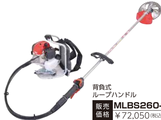
背負式 ループハンドル 販売価格 MLBS260-1 ¥72,050 (税込 10%)