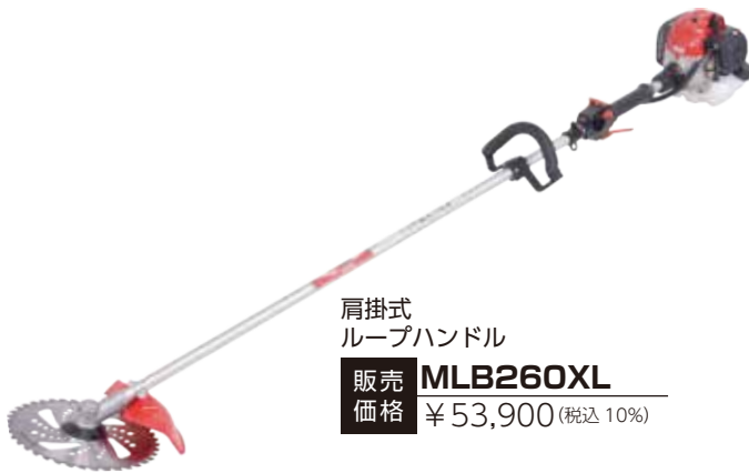
肩掛式 ループハンドル 販売価格 MLB260XL ¥53,900 (税込 10%)