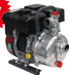
6月販売予定 販売価格 MLP2542E ¥73,150 (税込 10%) MLP4042E ¥73,700 (税込 10%)