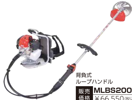
背負式 ループハンドル 販売価格 MLBS200-1 ¥66,550 (税込 10%)