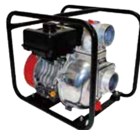
販売価格 MLP8041E ¥107,250 (税込 10%)