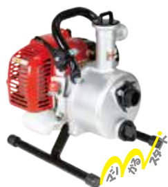
販売価格 MLP252E-1 ¥45,650 (税込 10%)