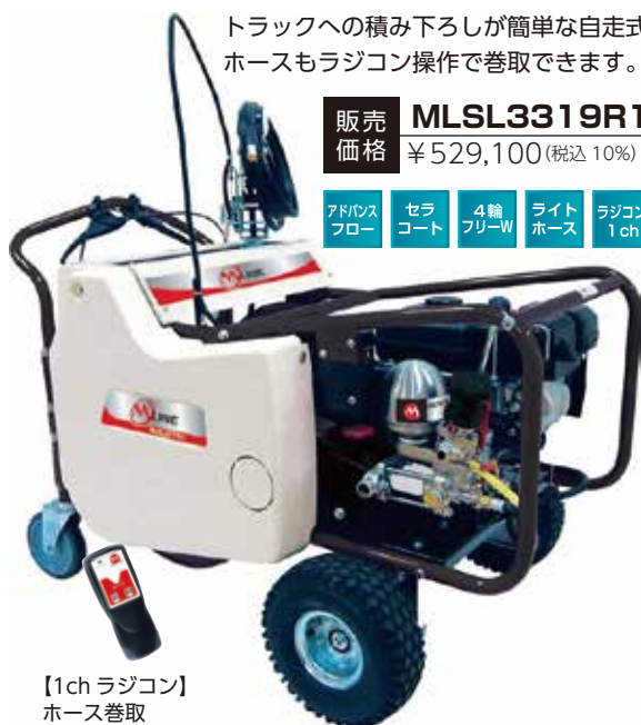
【1ch ラジコン】 ホース巻取