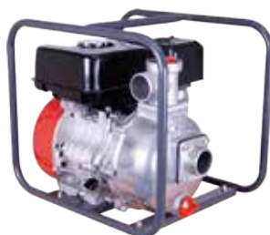
販売価格 MLP5041E ¥75,350 (税込 10%)