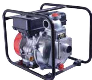
販売価格 MLP5140E ¥138,600 (税込 10%)