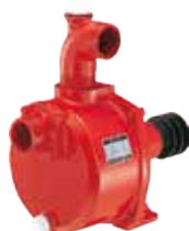
販売価格 MLP553-1 ¥80,850 (税込 10%)