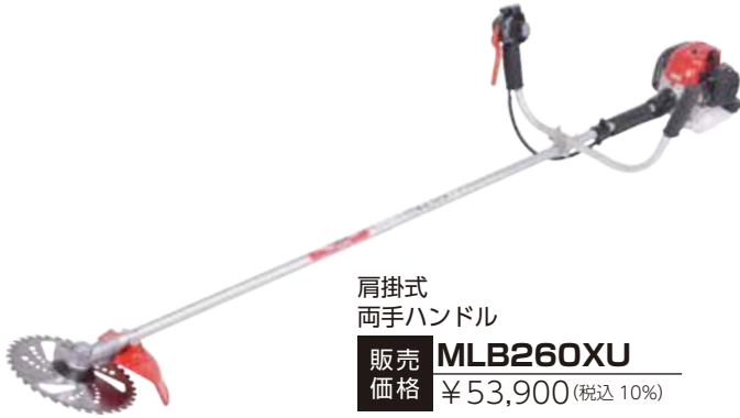
肩掛式 両手ハンドル 販売価格 MLB260XU ¥53,900 (税込 10%)