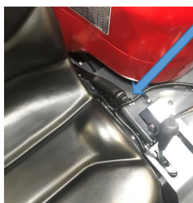
駐車ブレーキレバー