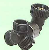
3方向切替ボディー ¥1,890 (税込) P/N 168294