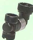
2方向切替ボディー ¥1,470 (税込) P/N 681679