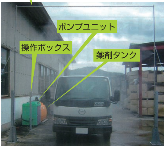
写真は手動式です。