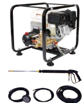
TSW41H 4サイクルエンジン

洗浄&農用防除兼用タイプ。洗浄ガン付き。 30L/分の水量でトラクター等の汚れを落とします。