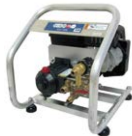
GS17EM 4サイクルエンジン