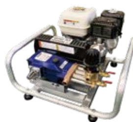
GS204E-H 4サイクルエンジン