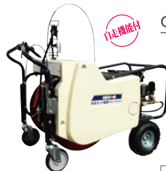
GSLF204-M 4サイクルエンジン

トラックへの乗せ降ろしが楽な自走タイプ レバーを引くとホースを巻取します。(自動整列)