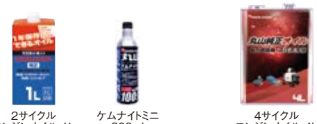
2サイクルエンジンオイル 1L ケムナイトミニ 300ml 4サイクルエンジンオイル 4L

購入時にはエンジン・ポンプにはオイルが入っておりません。 必ず給油してからお使いください。