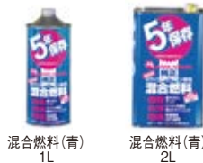
混合燃料(青) 1L 混合燃料(青) 2L