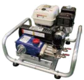
GS304E-H 4サイクルエンジン