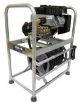
GS17EMSR 4サイクルエンジン