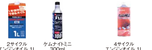
2サイクルエンジンオイル 1L ケムナイトミニ 300ml 4サイクルエンジンオイル 1L

購入時にはエンジン・ポンプにはオイルが入っておりません。 必ず給油してからお使いください。