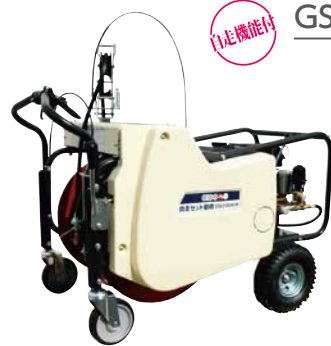
GSLF204-M 4サイクルエンジン

トラックへの乗せ降ろしが楽な自走タイプ レバーを引くとホースを巻取します。(自動整列)