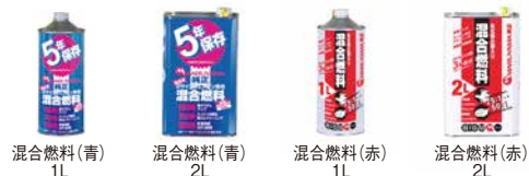
混合燃料(青) 1L 混合燃料(青) 2L 混合燃料(赤) 1L 混合燃料(赤) 2L