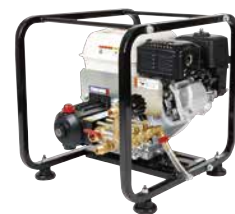
TSW41H 4サイクルエンジン

洗浄&農用防除兼用タイプ。洗浄ガン付き。 30L/分の水量でトラクター等の汚れを落とします。