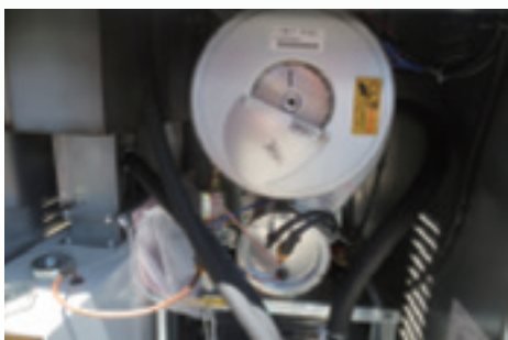
空焚防止装置を採用