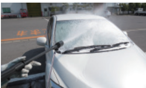
※オプション ソープノズル (高圧) 使用時