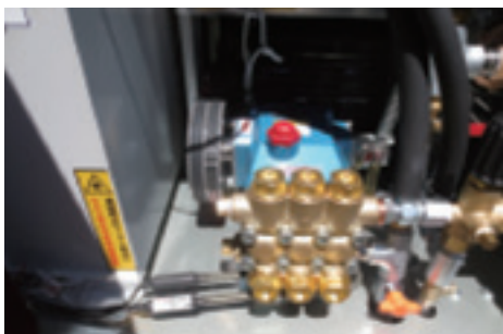
3連プランジャーポンプ搭載