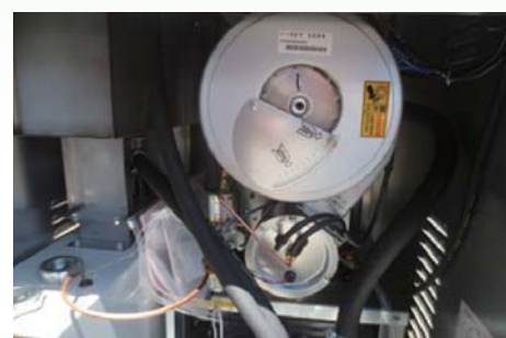
空焚防止装置を採用