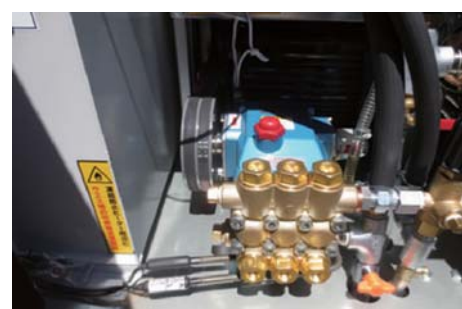
3連プランジャーポンプ搭載