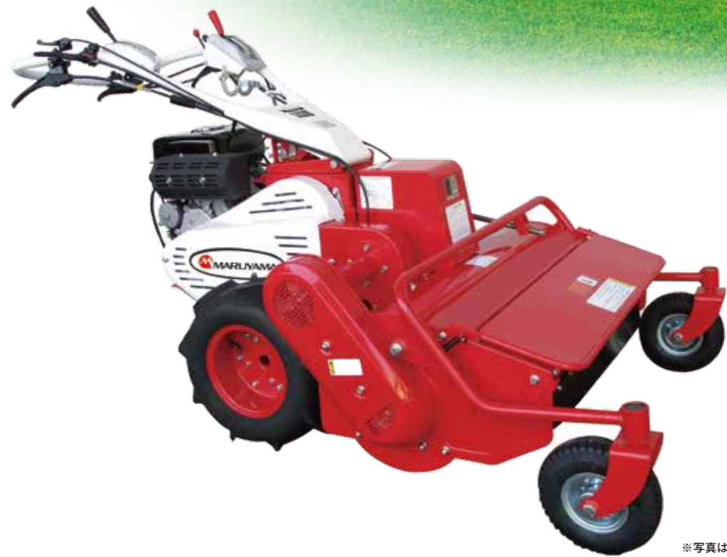
※写真は旧モデルです。