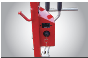
アワーメーター付きキーボックス

取り外しのできるフルオープンカバーなので、点検整備やオイル交換などがラクに行えます。