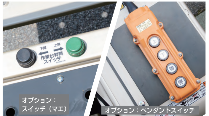
オプション： スイッチ（マエ）

リモコンは「上昇/下降」、「エンジン始動/停止」の操作が可能です。 フットスイッチは「上昇/下降」の操作がデッキで可能になります。