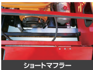
ショートマフラー

BOOM TYPE 電動、油圧ブームの2タイプに充実の機能装備。使い良さに磨きをかけました。