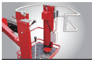
Wロック付きのゴンドラ

防水を考慮してキーボックスの中に入ロットルレバー・キースイッチを配置しました。アワーメーター付きなので定期点検・整備の目安に便利です。