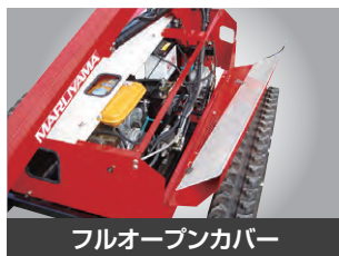
フルオープンカバー

エンジンマフラーを短くすることにより、排気カーボンが溜まりにくくなりました。(当社比)