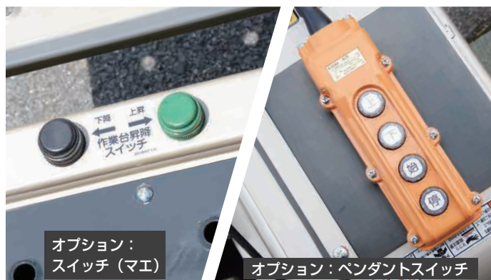
オプション： スイッチ（マエ）

リモコンは「上昇/下降」、「エンジン始動/停止」の操作が可能です。 フットスイッチは「上昇/下降」の操作がデッキで可能になります。