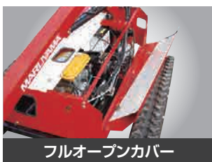
フルオープンカバー

エンジンマフラーを短くすることにより、排気カーボンが溜まりにくくなりました。(当社比)