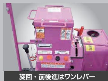
旋回・前後進はワンレバー