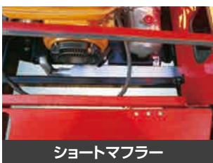
ショートマフラー

ブームスイングは電動式なのでエンジン停止時でも、点検できます。アワーメーター付きなので、点検整備の目安が判ります。折りたたみ式サドル、コンテナ台など作業しやすいオプションを用意しています。