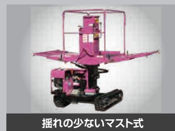
揺れの少ないマスト式

●メーカー希望小売価格(税込:税率8%)は、予告なく価格変更することがありますのでご了承願います。