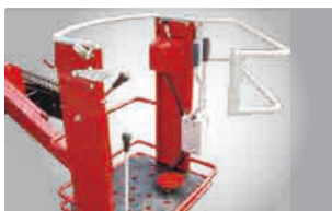
Wロック付きのゴンドラ

防水を考慮してキーボックスの中にスロットレバー・キースイッチを配置しました。アワーメーター付きなので定期点検・整備の目安に便利です。