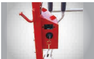
アワーメーター付きキーボックス

取り外しのできるフルオープンカバーなので、点検整備やオイル交換などがラクに行えます。