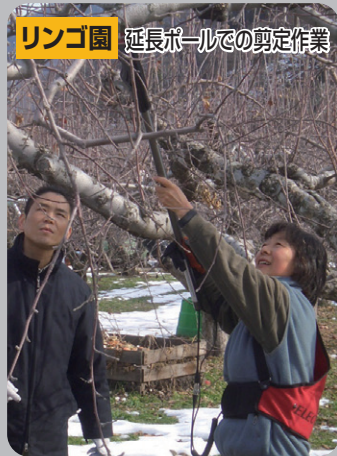
リンゴ園 延長ポールでの剪定作業