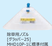
除草用ノズル [グラブ-25] MHD10P-1に標準付属