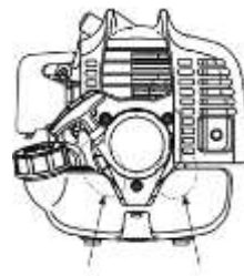
冷却風取り入れ口