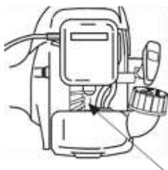
冷却風取り入れ口